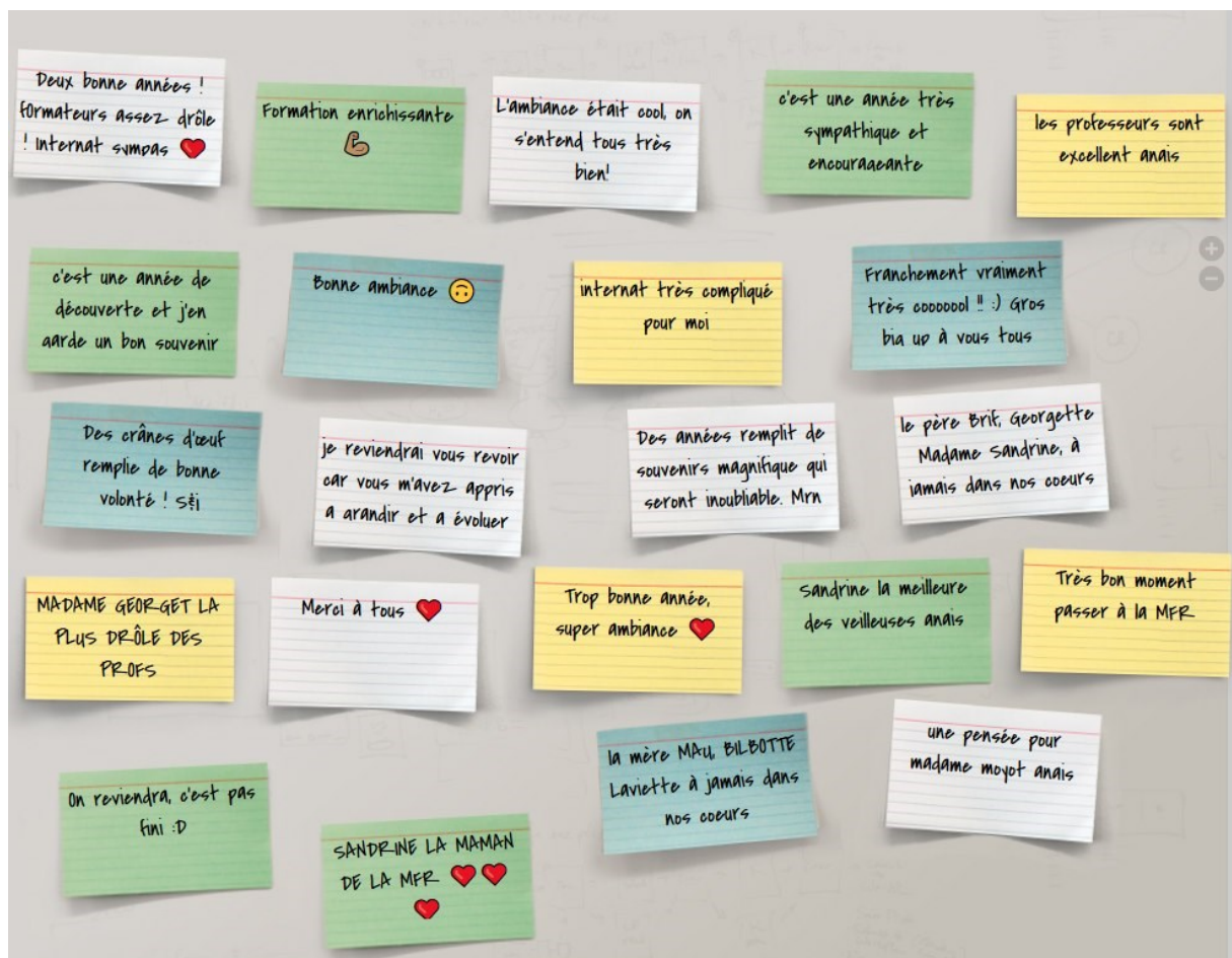
Nuage de mots – Terminales SAPAT-juin 2020